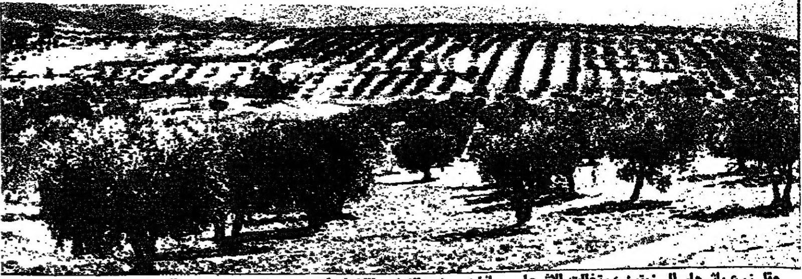
حقل زرع بانجار الزيتون ، وتخلت الأشجار مسافات مسن الإرض القضاء لتعرضها لآسمة الشمس والهواء .

عقد في باريس المؤتمر الدولي لعلماء طبقات الأرض . ويضم المؤتمر خمسة آلاف عالم واخصائي ينتمون إلى نحو مئة دولة . وهذه هي المرة السادسة والعشرون التي يعقد فيها مثل هذا المؤتمر . الهدف الأول من المؤتمر هو التمسك العلمي في الأبحاث المتعلقة بعلوم الأرض . لم يبحث عن جميع التطبيقات العملية المختصة . ولا تفتي فائدة هذه التطبيقات في الساعات الخاضعة نظراً لحاجات العالم إلى المواد الأولية والطاقات ، فضلاً عن حاجته إلى بيئة طبيعية سليمة . في مجال علم جوف الأرض ربما أصبح الاهتمام يتركز على استنباط ثروة كانت مهمة حتى الآن ، وهي الثروة الحرارية الناتجة من وجود بخار حقيقية من الماء الحار على عمق ألف والفين تحت سطح الأرض .